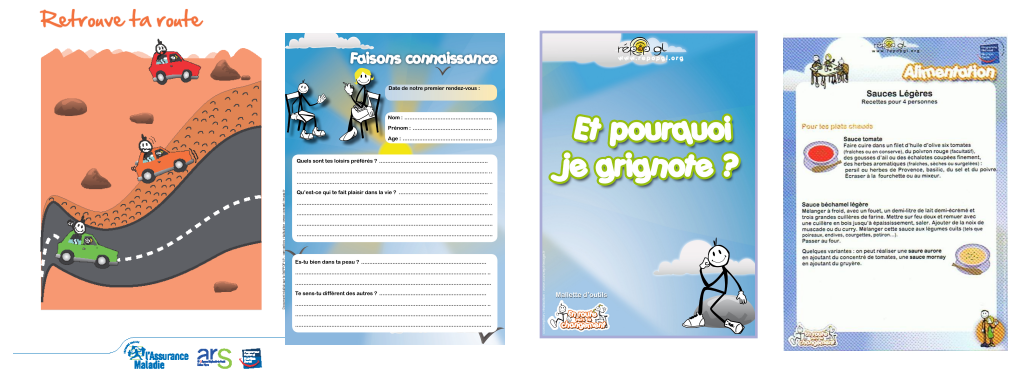
Mes 5 équilibres